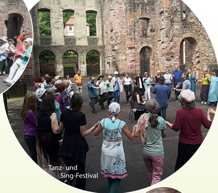
Tanz- und Sing-Festival